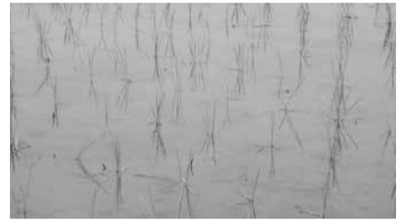
▲3～4本植えイメージ 平均3本/株