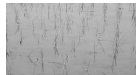
▲3~4本植えイメージ 平均3本/株