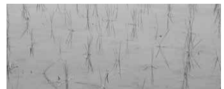
▲3~4本植えイメージ 平均3本/株