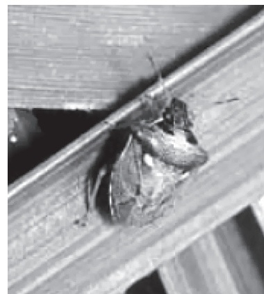
トゲシラホシカメムシ (体長 5～7mm)