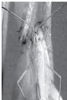
アカヒゲホソドリカスミカメ (体長 5～6.5mm)