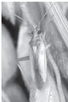
アカスジカスミカメ (体長 4.6～6mm)