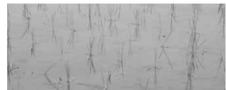
▲細植イメージ 「うま・きれ総合実証圃」平均3本/株